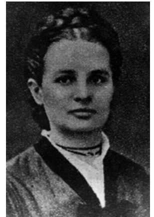
Emma Ihrer wurde am 3. Januar 1857 geboren und gehörte Ende des 19. Jahrhunderts zu den führenden Gewerkschafterinnen in Deutschland. Sie starb 1911.

Tausende von InternetnutzerInnen dürften so erfahren haben, was Emma Ihrer in ihrem Leben geleistet hat: Unter anderem gründete sie 1881 den Frauen-Hilfsverein für Handarbeiterinnen, einige Jahre später den Verein zur Wahrung der Interessen der Arbeiterinnen in Berlin. Gemeinsam mit Clara Zetkin erreichte sie zudem, dass Frauen in den Gewerkschaften als gleichberechtigt anerkannt wurden. Ende 1890 wurde sie als erste Frau neben sechs Männern in die Generalkommission der Gewerkschaften Deutschlands gewählt. Dank Google wissen davon nun sehr viele Menschen. Auf der DGB-Internetseite gibt es den Link zum Doodle: www.dgb.de/-/Ebj