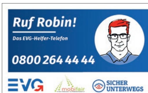
Die Hotline der EVG ist seit 12. September 2017 geschaltet. Kolleginnen und Kollegen erhalten hier nach Übergriffen rechtliche Beratung und soziale Unterstützung.

Der DGB-Index Gute Arbeit hat einen Personalmangel von 110000 Beschäftigten im öffentlichen Dienst festgestellt. Resultat: Die Beschäftigten sind an ihrer Belastungsgrenze. Elke Hannack fordert deswegen eine „zukunfts-fähige Personalpolitik, die langfristig angelegt ist“.