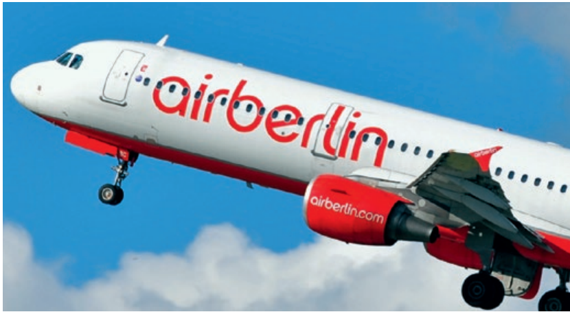
Air Berlin fliegt nicht mehr - Transfergesellschaften schützen Beschäftigte vor dem Gang zur Arbeitsagentur und helfen bei der Jobsuche.

Seit Oktober 2017 ist die Fluggesellschaft Air Berlin Geschichte. Viele der rund 8000 Beschäftigten blicken einer ungewissen Zukunft entgegen. Transfergesellschaften sollen helfen, neue berufliche Wege zu finden.