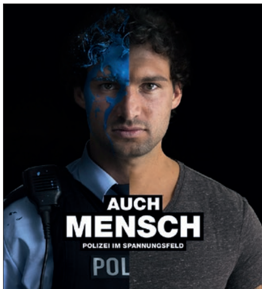
Die Junge Truppe der GdP macht mit der Kampagne „Auch Mensch“ klar: Auch PolizistInnen haben ein Privatleben, Familien und Freunde.

Sie wollen helfen und einfach nur ihre Arbeit tun – und werden angegriffen und oft auch verletzt. Beschäftigten bei Polizei, Rettungsdiensten, bei der Bahn oder im öffentlichen Dienst schlägt immer wieder Gewalt entgegen. Das Phänomen ist nicht neu, aber es äußert sich massiver.