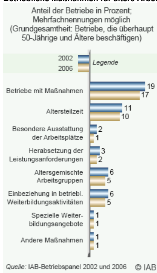
Abbildung 1: Betriebliche Maßnahmen für ältere Arbeitnehmer

Aus IAB-Kurzbericht 21/2007, S. 3, Abb. 4