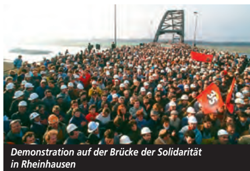
Demonstration auf der Brücke der Solidarität in Rheinhausen

MITBESTIMMUNG. Nach dem Zweiten Weltkrieg ziehen ArbeiterInnen die Lehre aus der Katastrophe des Nationalsozialismus: Künftig sollen die Beschäftigten mehr Mitsprache haben. Als sich Anfang der 50er-Jahre der Wind dreht, die Unternehmer wieder Oberwasser gewinnen und das Gesetz zur Montanmitbestimmung zurückdrehen wollen, beschließt die IG Metall: Notfalls streiken wir für die Montanmitbestimmung. Die Drohung wirkt. Noch bevor es zum Streik kommt, lenken die Arbeitgeber ein.