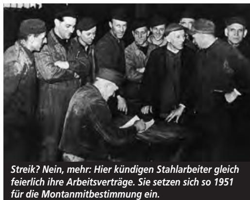
Streik? Nein, mehr: Hier kündigen Stahlarbeiter gleich feierlich ihre Arbeitsverträge. Sie setzen sich so 1951 für die Montanmitbestimmung ein.

zeit von 48 auf 45 und schließlich auf 40 Stunden, mehr Urlaub, das zusätzliche Urlaubsgeld, der freie Samstag. 1956/57 streikt sie 16 Wochen lang für die Lohnfortzahlung im Krankheitsfall - und setzt dieses Ziel erstmals durch. Wenige Monate später verabschiedet der Bundestag dann auch eine gesetzliche Regelung zur Lohnfortzahlung.