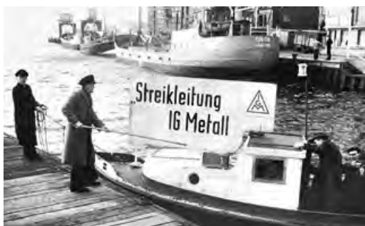
Streik für die Lohnfortzahlung im Krankheitsfall 1956/57: Die Streikleitung schipperte auf einer eigens angemieteten Barkasse im Kieler Hafen.