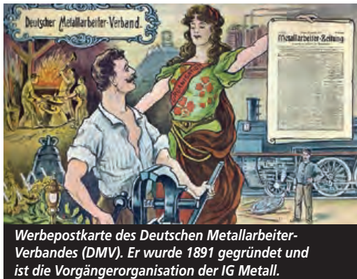
Werbepostkarte des Deutschen Metallarbeiter-Verbandes (DMV). Er wurde 1891 gegründet und ist die Vorgängerorganisation der IG Metall.