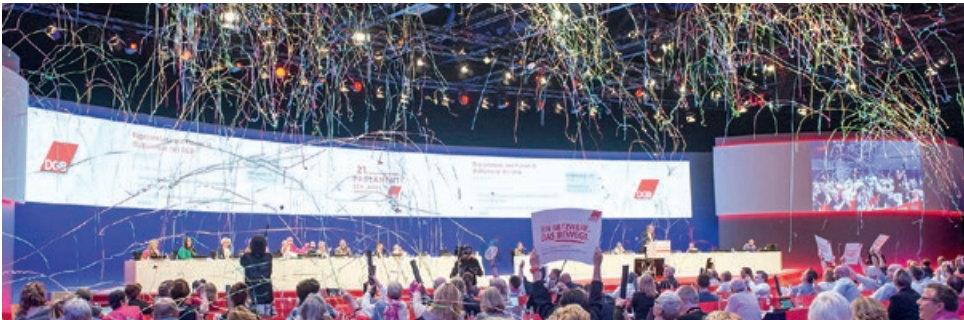
Bunte Luftschlangen im Saal – soeben wurde die Frauen-Quote für DGB-Wahlämter beschlossen.